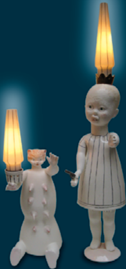
Flickan med katt