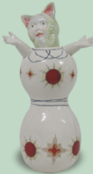
Jag vet inte