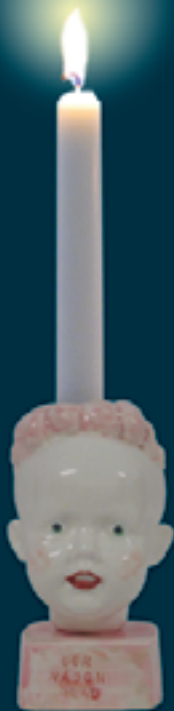
Gör någon glad