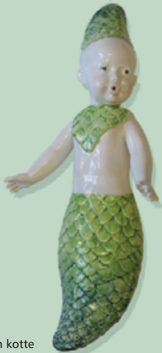
Inte en kotte