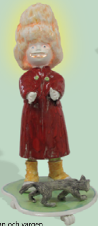
Rödluan och vargen