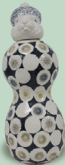
Det är omöjligt att säga