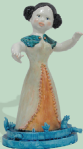
Snövit och de sju dvärgarna